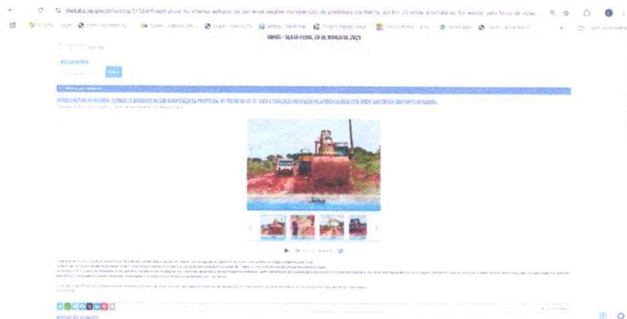
FOTO: Notícia de reestruturação de ponte entre Barreiras e Itaituba